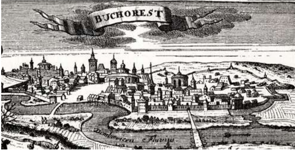
(Early 18th century woodcut (1717))

First mentioned as the "Citadel of București" in 1459, it became the residence of the famous Wallachian prince Vlad III the Impaler.