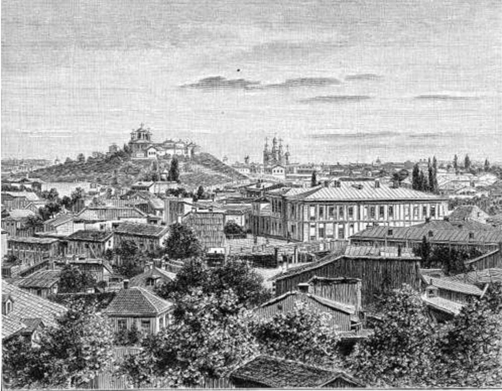
București. (Nach Photographie.) Bgl. Text, S. 278.