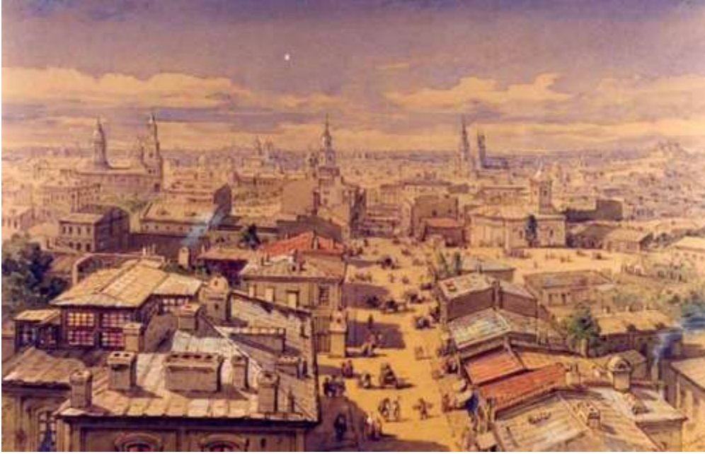
(Bucharest in 1868, seen from Turnul Colțea)

In 1862, after Wallachia and Moldavia were united to form the Principality of Romania, Bucharest became the new nation's capital city. In 1881, it became the political centre of the newly proclaimed Kingdom of Romania under King Carol I. During the second half of the 19th century the city's population increased dramatically, and a new period of urban development began. During this period, gas lighting, horse-drawn trams and limited electrification were introduced. The Dâmbovița river was also massively channelled in 1883, thus putting a stop to previously endemic floods like the 1865 flooding of Bucharest. The Fortifications of Bucharest were built. The extravagant architecture and cosmopolitan high culture of this period won Bucharest the nickname of "Little Paris" ( Micul Paris ) of the east, with Calea Victoriei as its Champs-Élysées.