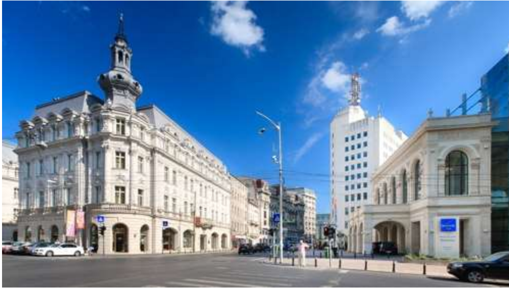
(Calea Victoriei, https://en.wikipedia.org/wiki/File:Hotel_Continental_-_Calea_Victoriei.jpg )

project finished at this time is the impressive Basarab overpass, which is Europe's widest cable bridge.