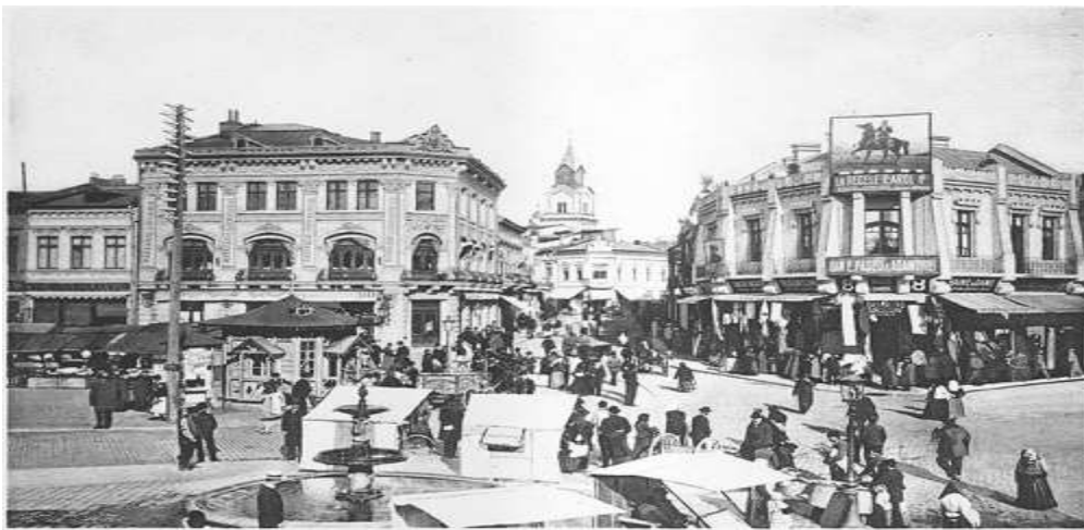
(St. Anton Square during 1900s)

In 1862, after Wallachia and Moldavia were united to form the Principality of Romania, Bucharest became the new nation's capital city. In 1881, it became the political centre of the newly proclaimed Kingdom of Romania under King Carol I. During the second half of the 19th century the city's population increased dramatically, and a new period of urban development began. During this period, gas lighting, horse-drawn trams and limited electrification were introduced. The Dâmbovița river was also massively channelled in 1883, thus putting a stop to previously endemic floods like the 1865 flooding of Bucharest. The Fortifications of Bucharest were built. The extravagant architecture and cosmopolitan high culture of this period won Bucharest the nickname of "Little Paris" ( Micul Paris ) of the east, with Calea Victoriei as its Champs-Élysées.