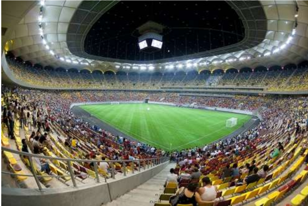
(Arena Națională)

Fotbalul este sportul cel mai îndrăgit în București, orașul având numeroase echipe de club, unele dintre ele fiind cunoscute în toată Europa: Steaua, Dinamo sau Rapid.