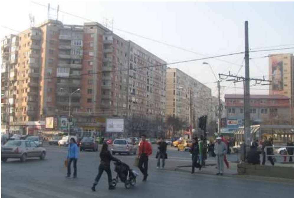
(Dristor, București)