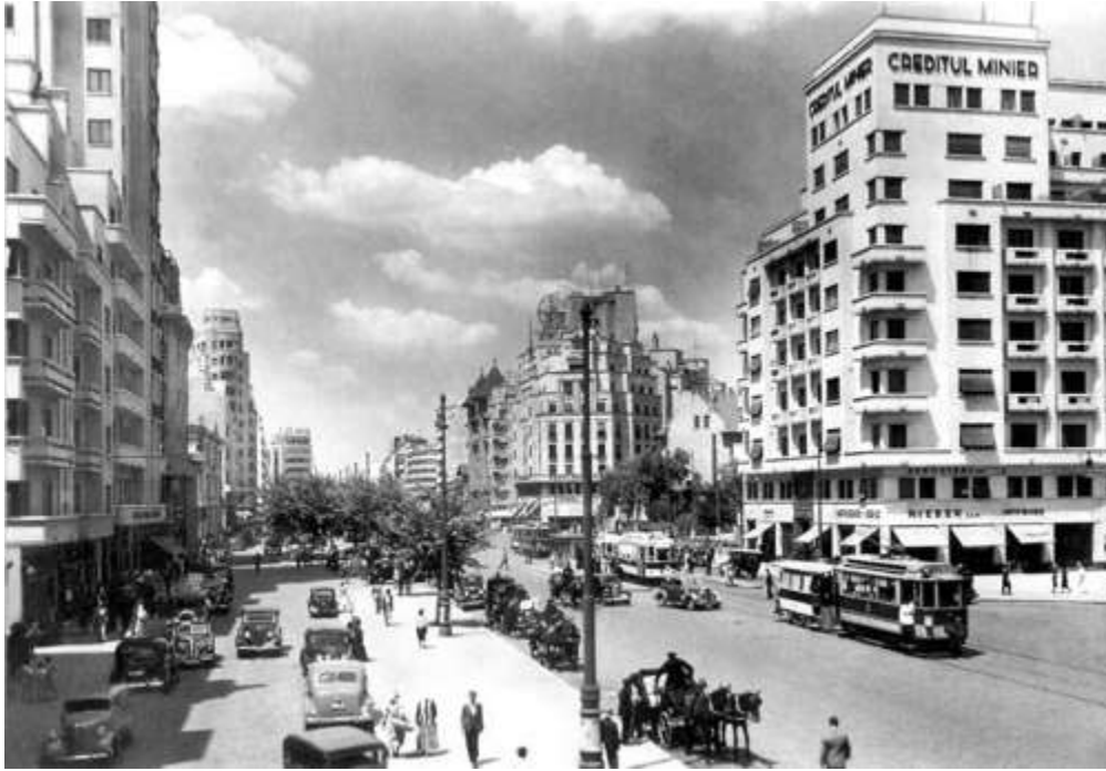
Brătianu Boulevard in the 1930s)

centered in Vrancea, about 135 km (83.89 mi) away, claimed 1,500 lives and caused further damage to the historic centre.