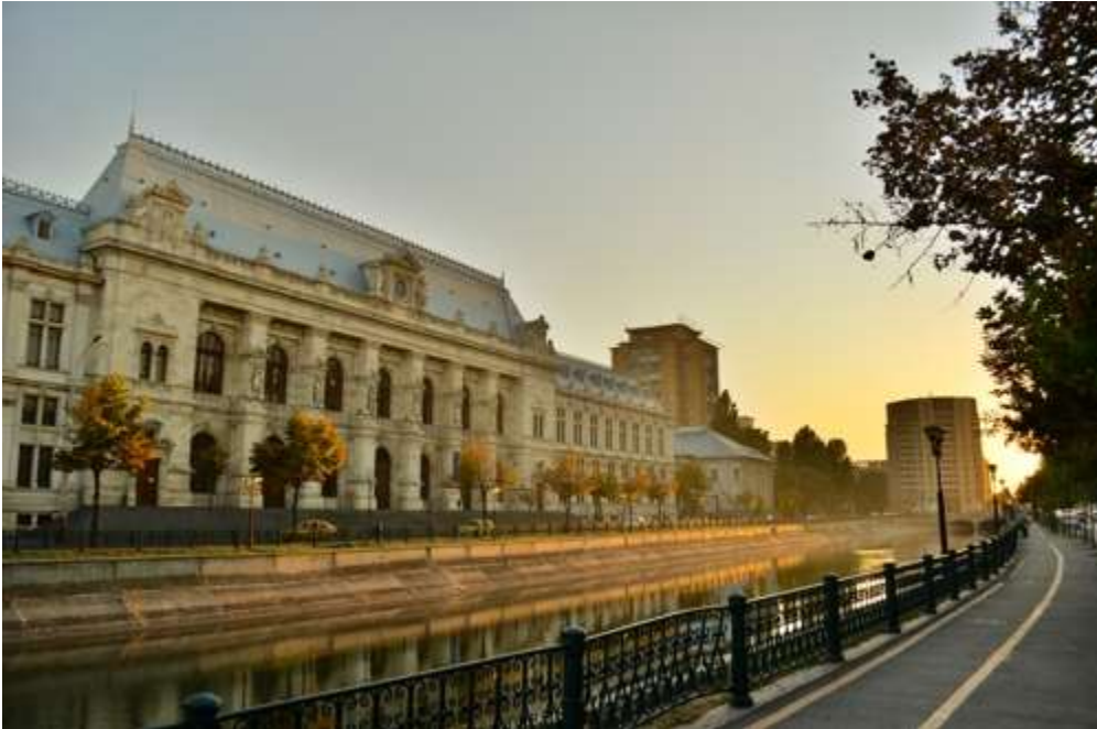
(The Palace of Justice viewed across the Dâmbovița River )

Bucharest's judicial system is similar to that of the Romanian counties. Each of the six sectors has its own local first instance court ( judecătorie ), while more serious cases are directed to the Bucharest Tribunal (Tribunalul București), the city's municipal court. The Bucharest Court of Appeal (Curtea de Apel București) judges appeals against decisions taken by first instance courts and tribunals in Bucharest and in five surrounding counties (Teleorman, Ialomița, Giurgiu, Călărași and Ilfov). Bucharest is also home to Romania's supreme court, the High Court of Cassation and Justice, as well as to the Constitutional Court of Romania.