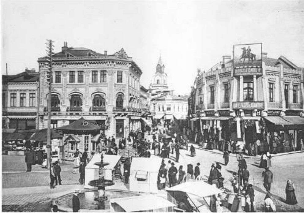
Anton în anii 1900)