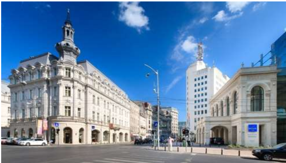
(Calea Victoriei, https://en.wikipedia.org/wiki/File:Hotel_Continental_-_Calea_Victoriei.jpg )

București este principalul punct de intrare în România. Este un oraș în plină expansiune, cu multe proiecte mari de infrastructură schimbând fața veche a orașului. Cunoscut în trecut ca "Micul Paris", București s-a schimbat foarte mult în ultima vreme, iar astăzi a devenit un amestec foarte interesant de vechi și nou, care are prea puțin de-a face cu reputația sa inițială. O biserică veche de 300 ani în apropierea unei clădiri de oțel și sticlă și amândouă alături de o clădire în stil comunist este un lucru obișnuit în București. Orașul oferă câteva atracții excelente, și în ultimii ani a cultivat o sensibilitate sofisticată, modernă și mondenă, pe care mulți se așteaptă să o găsească la o capitală europeană. București a trecut prin mai multe programe de modernizare majore în ultimii ani și unele sunt încă în derulare și în anii următori. Cei care știau Bucureștiul în trecut dar nu l-au vizitat după 2010 vor fi surprinși de amploarea schimbărilor care au avut loc. Centrul orașului este complet reînnoit, și există un proiect major în fiecare parte a orașului. Bucureștiul a beneficiat de un boom economic, ajutat și de subvențiile Uniunii Europene prin care s-au reconstruit părți ale orașului. Proiecte ambițioase sunt destul de comune în București. Cel mai mare proiect finalizat în acest moment este podul Basarab, impresionant, care este cel mai mare pod din Europa pe cablu.