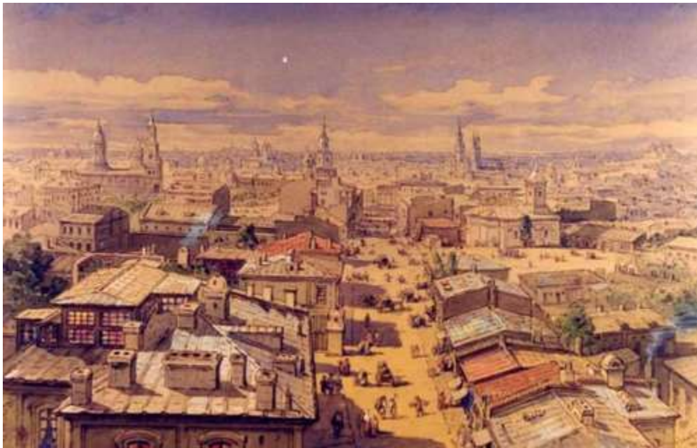
în 1868, văzut din Turnul Colțea)

Parțial distrus de catastrofe naturale și reconstruit de mai multe ori în următorii 200 de ani, și apoi lovit de ciuma lui Caragea, în 1813-1814, orașul a fost smuls de sub controlul otoman și control și ocupat în mai multe rânduri de către monarhia habsburgică (1716, 1737, 1789) și imperiul rus (de trei ori între 1768 și 1806). A fost pus sub administrația rusă între 1828 și războiul Crimeei, cu un interludiu în timpul revoluției din 1848, iar o garnizoană austriacă l-a controlat după plecarea rușilor (a rămas în oraș până în martie 1857). În plus, la 23 martie 1847, un incendiu a distrus aproximativ 2.000 de clădiri, o treime din oraș.