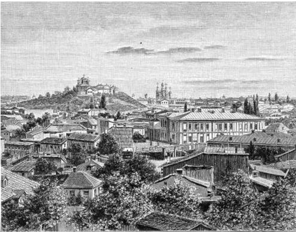
Bucarest. (Nach Photographie.) Bgl. Text, S. 278.